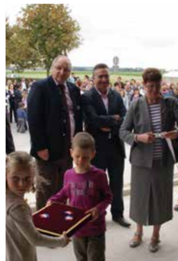
Inauguration de l'école des Deux Moulins à Livry-Louvercy en septembre 2011. Cet établissement accueille aujourd'hui plus de 170 élèves en maternelle et primaire.