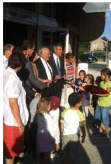
Inauguration de la nouvelle garderie-cantine à Courtisols le 30 août 2012. Ce nouveau bâtiment permettra d'accueillir jusqu'à 150 enfants.

développement, consulter les études et documents mis à disposition, ou exploiter les nombreux documents cartographiques réalisés par l'Agence d'Urbanisme et de Développement de l'agglomération et du Pays de Châlons-en-Champagne.