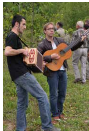
Inauguration en musique du jardin sensoriel et du bois pédagogique de la commune d'Haussimont, en juin 2011.