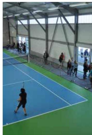
Inauguration du complexe sportif de la Communauté de communes de l'Europarc en juin 2012.